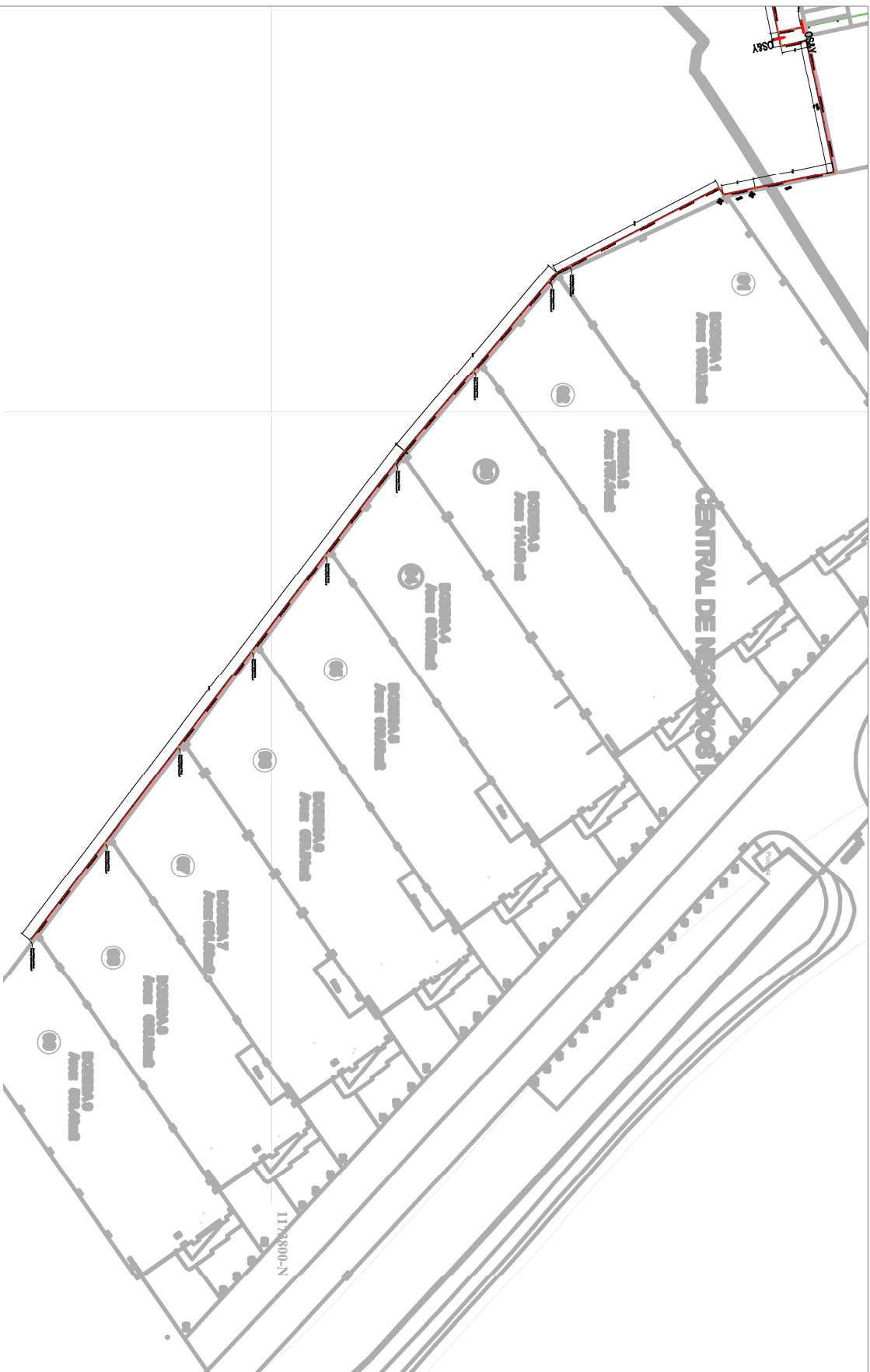
RED GENERAL VISTA EN PLANTA